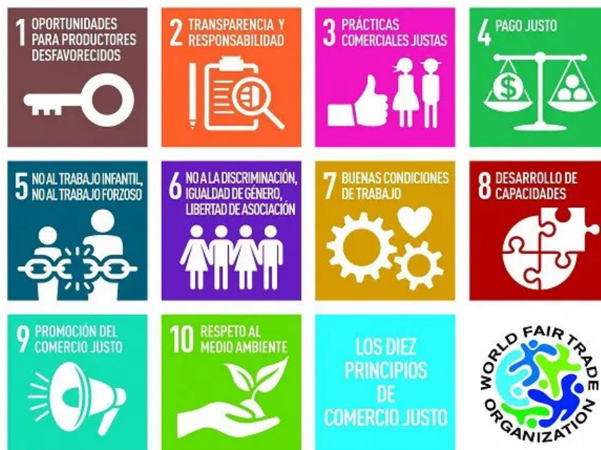
10 principios del comercio justo (WFTO)